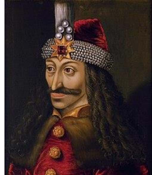
Vlad III l'Impalatore (1431-1477)

noto come Vlad Dracula fu principe di Valacchia in tre periodi tra il 1448 e il 1476.