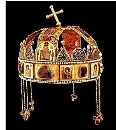
La corona di Re Stefano (969 –1038) Il re fu canonizzato nel 1083