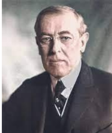
Woodrow Wilson (1856-1924) Presidente USA 1913-1921

8 Gennaio 1918 – il presidente USA Wilson in un discorso al Congresso presenta per il dopoguerra un programma in 14 punti :