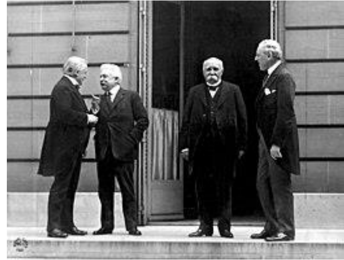
Da sinistra a destra: David Lloyd George, Vittorio Emanuele Orlando, Georges Clemenceau, Woodrow Wilson

Nascita di nuove nazioni: Austria , Ungheria , Cecoslovacchia , Finlandia , Repubblica Turca , Regno dei Serbi, Croati e Sloveni , Regno del Montenegro