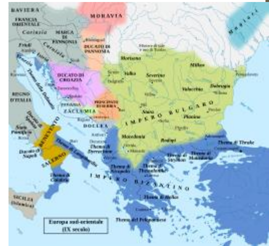
1° Regno bulgaro