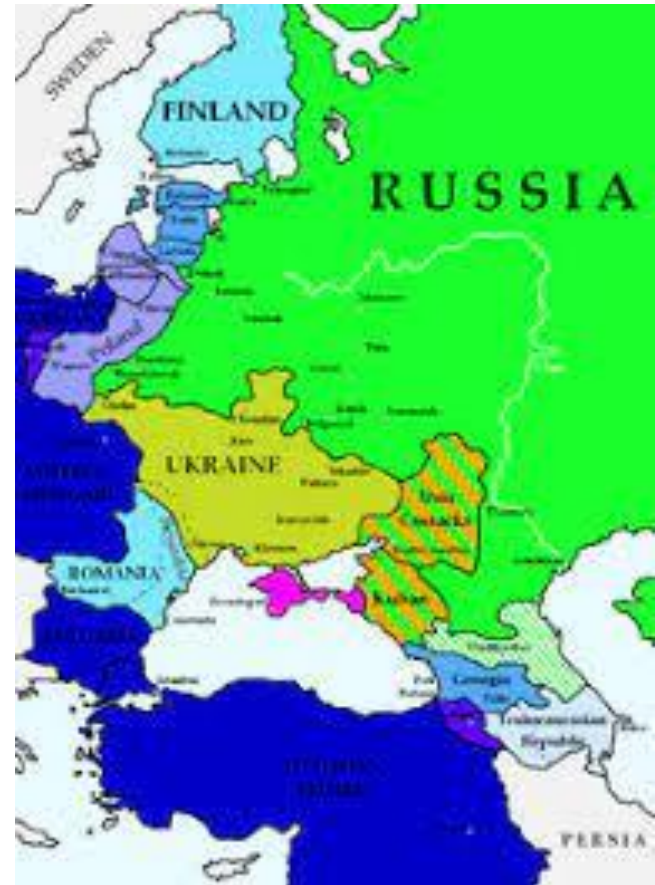
La Russia e le perdite territoriali del 1918