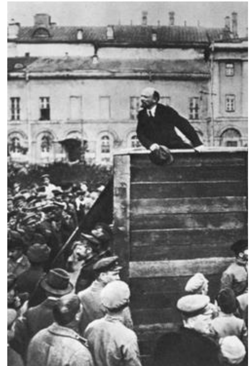
Aprile 1917 – Lenin arringa la folla