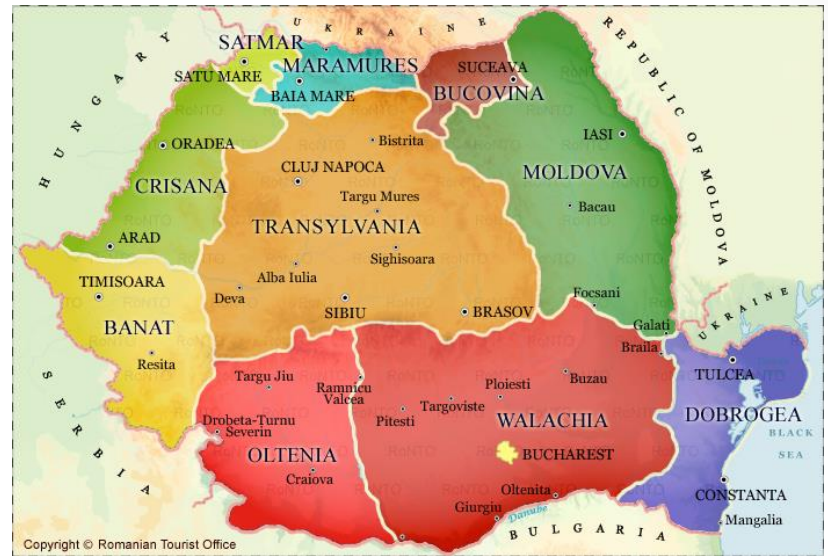
Le regioni della Romania