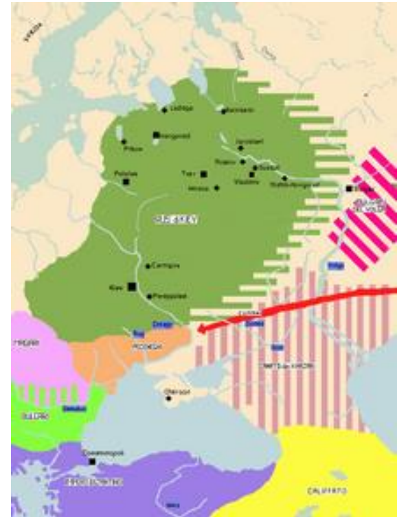
Estensione della Rus' di Kiev nell'XI sec.