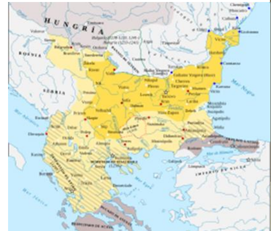
2° Regno bulgaro nel 1230 Epoca della massima espansione