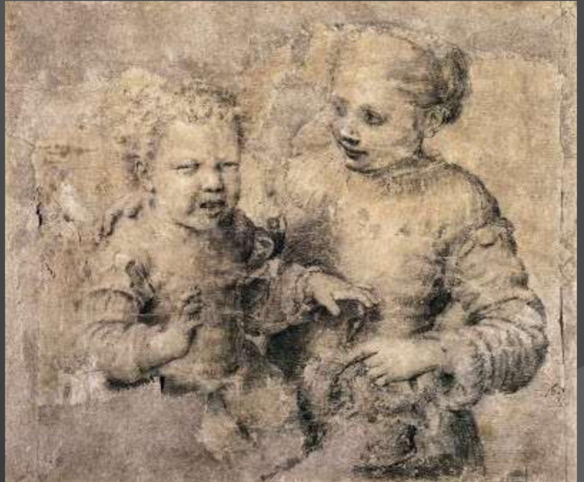
S. Anguissola, fanciullo morso da un gambero, 1560, Napoli, Museo di Capodimonte