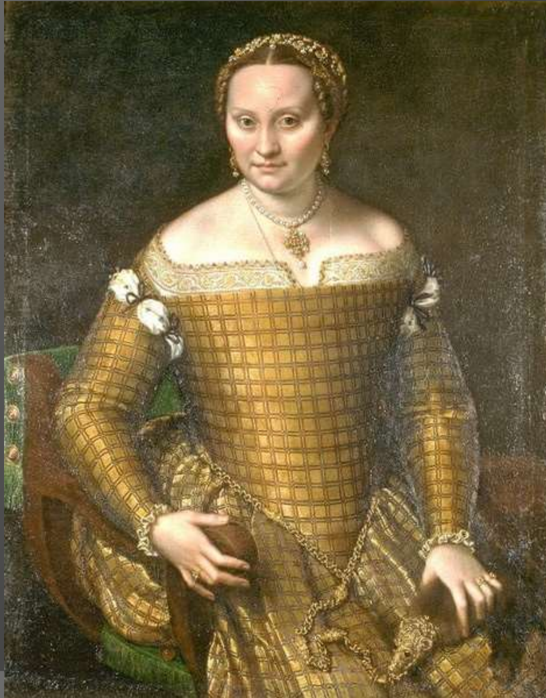
S. Anguissola, Ritratto Bianca Ponzoni Anguissola, 1557, Berlino, Gemaldegalerie