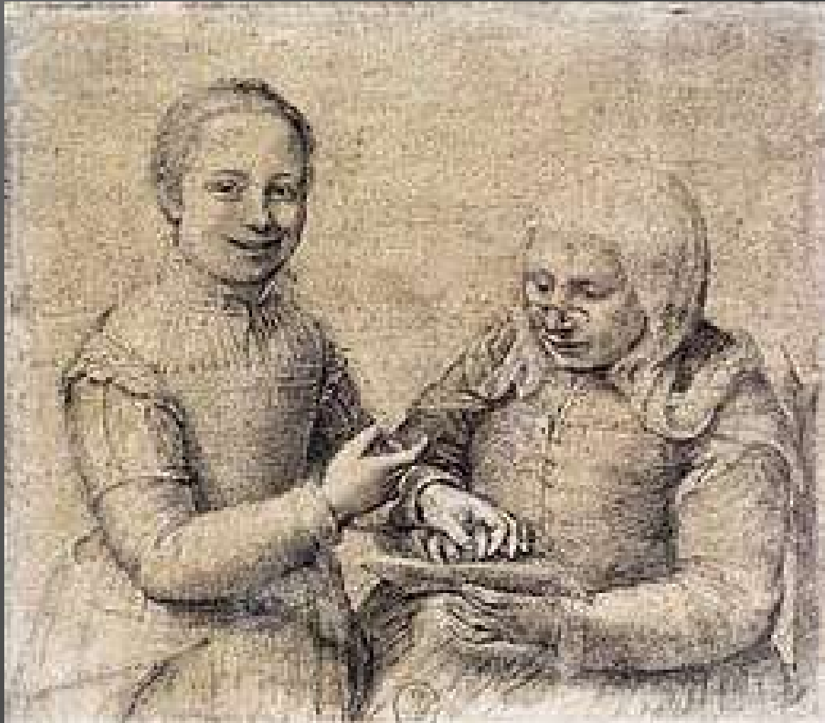
S. Anguissola, Vecchia che studia l'alfabeto ed è derisa da una bambina, 1559, Firenze, Uffizi