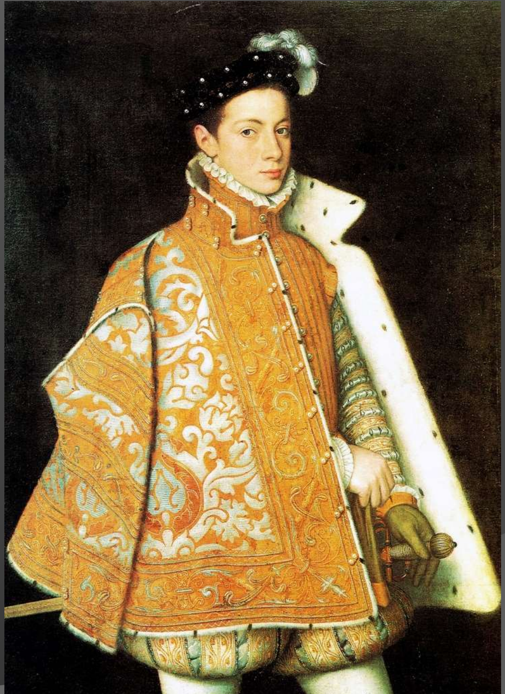
S. Anguissola, Ritratto a Alessandro Farnese, 1560, Dublino, Galleria Nazionale d'Irlanda