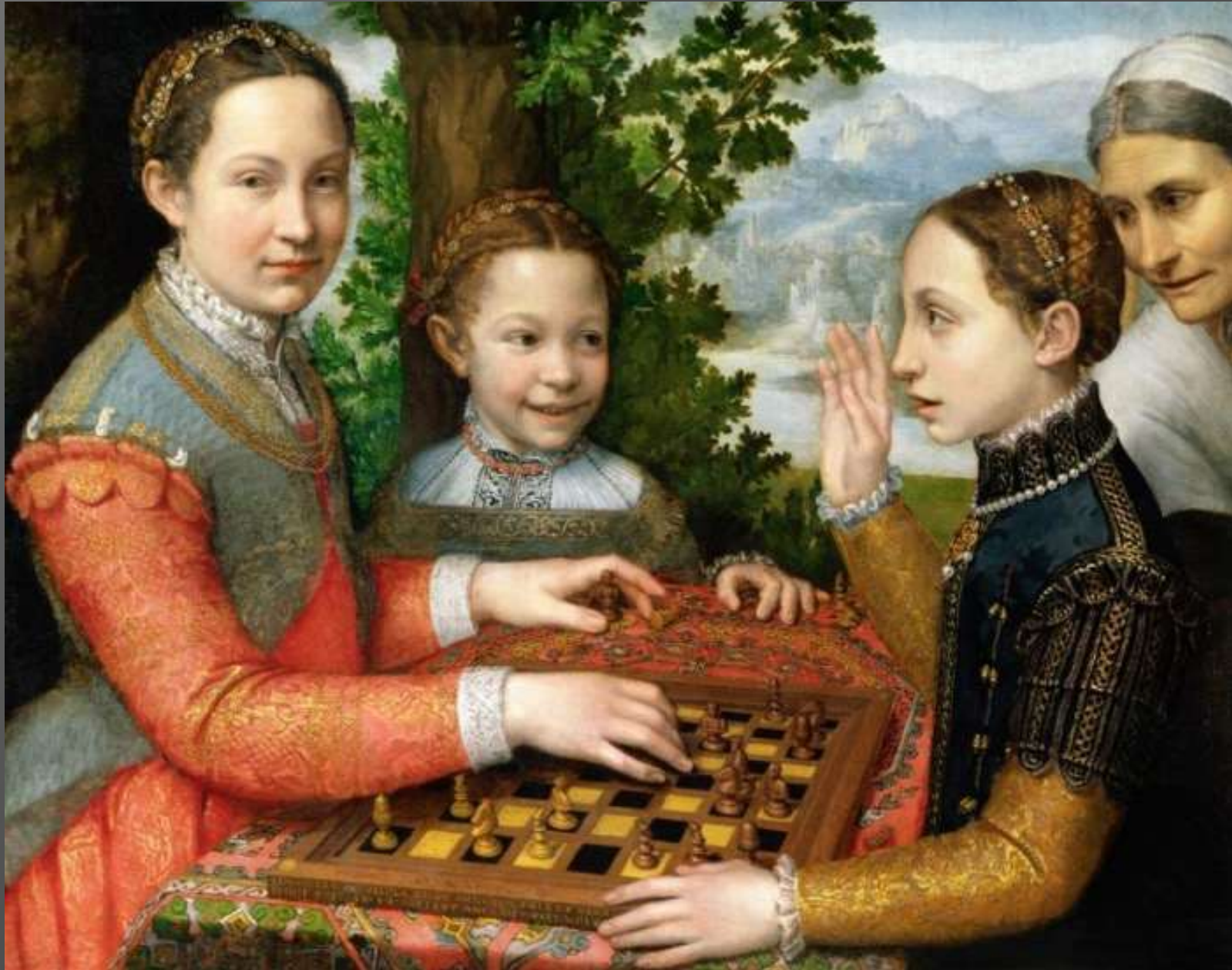
S, Anguissola, Partita a scacchi, 1555, Poznan, Narodowe Muzeum