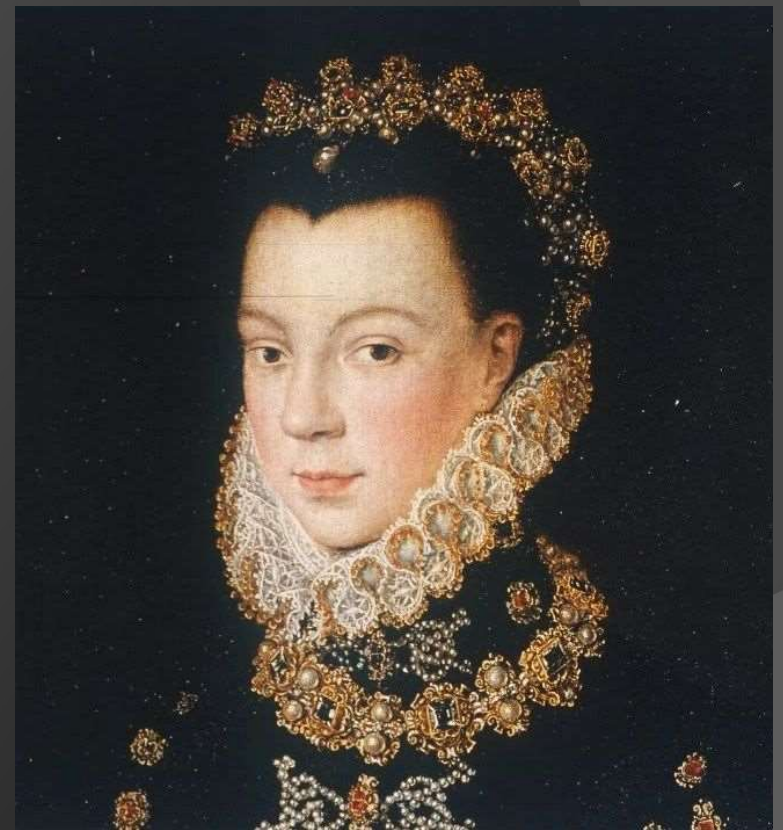
S. Anguissola, Ritratto a Elisabetta di Valois, 1561-65, Madrid, Museo del Prado