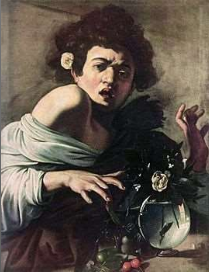
Caravaggio, Ragazzo morso da un ramarro, 1595-1596, Firenze, Fondazione Longhi