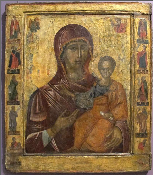
Icona processionale di Maria Odigitria tra profeti, 1512-13