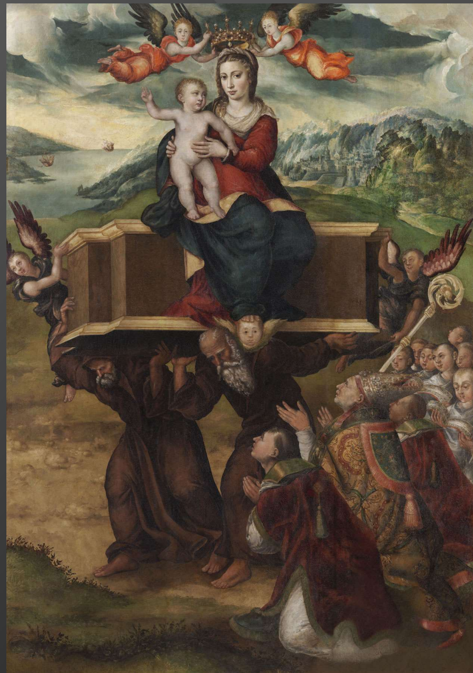
S. Anguissola, Madonna dell'Itria, 1578-1579, Paternò, parrocchia Santa Maria dell'Alto