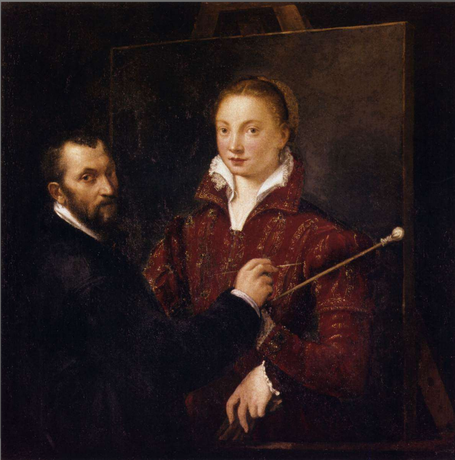
S. Anguissola Bernardino Campi ritrae Sofonisba, 1559, Siena, Pinacoteca Nazionale