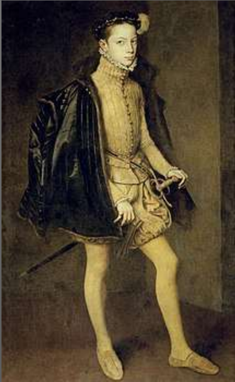
Anthonis Mor, Ritratto di Alessandro Farnese, 1557, Parma, Galleria Nazionale