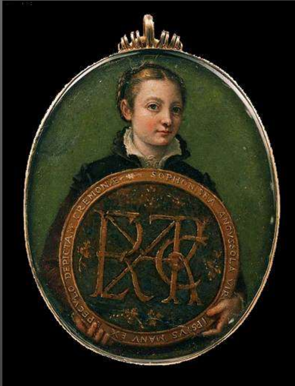
S. Anguissola, Autoritratto in miniatura, 1556, Boston, Museum of Fine Arts