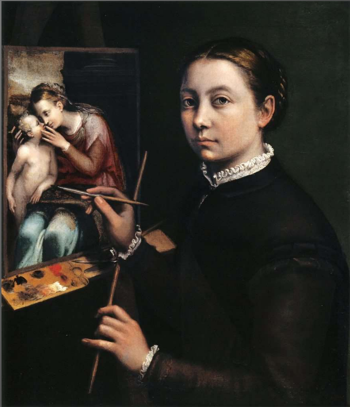
Sofonisba Anguissola, Autoritratto, 1556-65, Lancult, Castello di Lancult