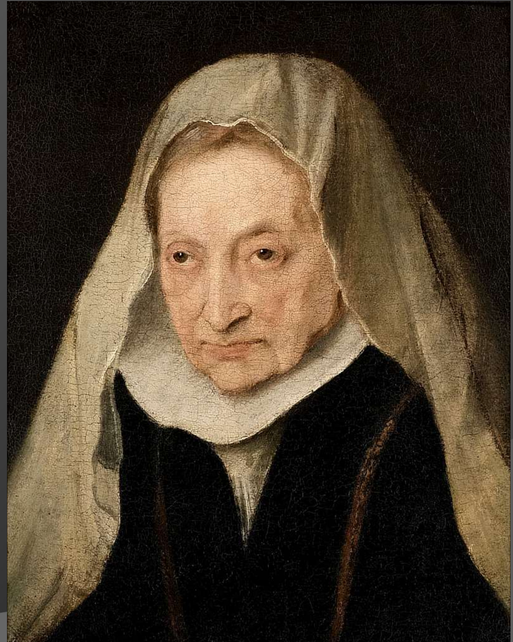
Anton Van Dyck, Ritratto di Sofonisba Anguissola, Palermo, 1624