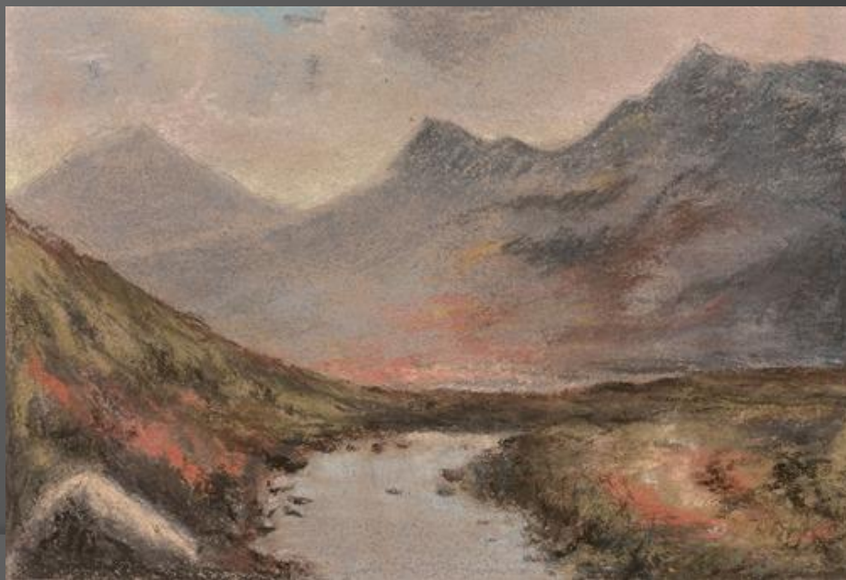
Una veduta alpina – Élisabeth Vigée-Lebrun