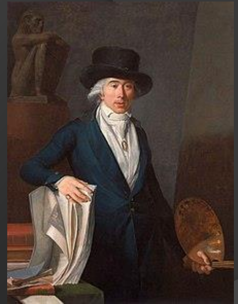
Jean-Baptiste-Pierre Le Brun, Autoritratto, 1795, collezione privata