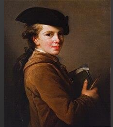
Louise-Elisabeth Vigée Le Brun, ritratto al fratello Etienne, 1773