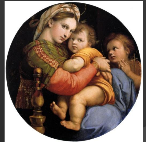
Raffaello Sanzio, Madonna della seggiola , 1513-14, Firenze, Galleria Palatina